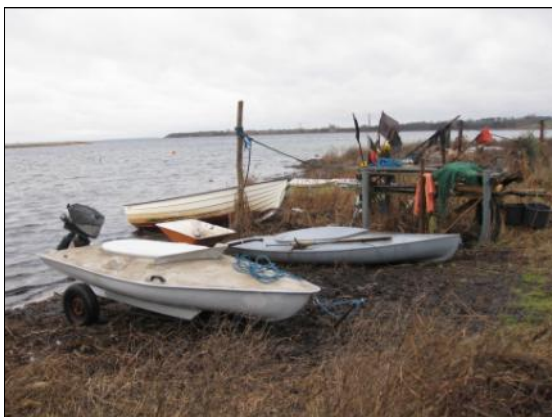
Stemningsbillede fra Thorøhuse.

Samme dag og sted inviteres interessenterne til buffet kl. 18.00 i anledning af møllens 10-års jubilæum.