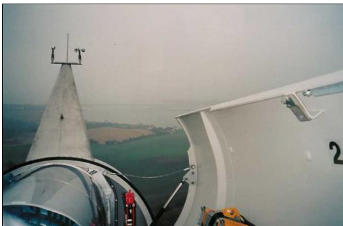
Vejrstationen på toppen af vindmøllen.

Har du mistet pusten? Vejrmedlinger skal du i alt fald ikke mangle. Og så er opremsningen slet ikke fyldestgørende (der er endnu flere). Rigtig god tur til lands og til vands.