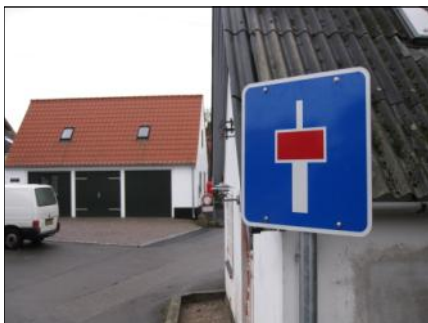
Endnu et nyt skilt i Thorøhuse ved Torø Gyde